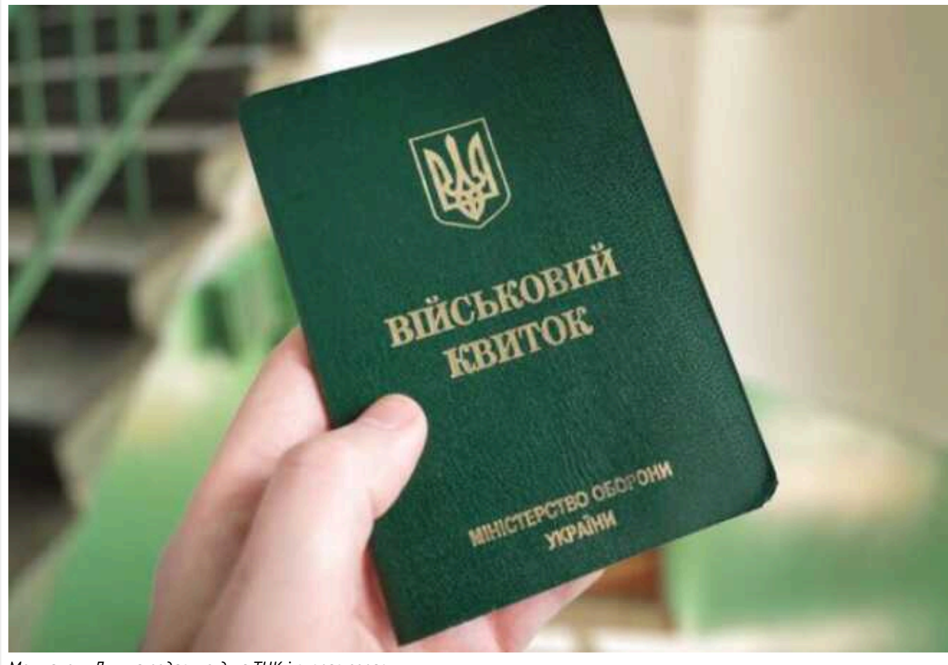
Мешканець Луцька подав у суд на ТЦК і виграв справу

Житель Луцька Волинської області виграв суд проти районного центру комплектування та соціальної підтримки (ТЦК). Той звинуватив чоловіка в порушенні правил військового обліку й призначив штраф.