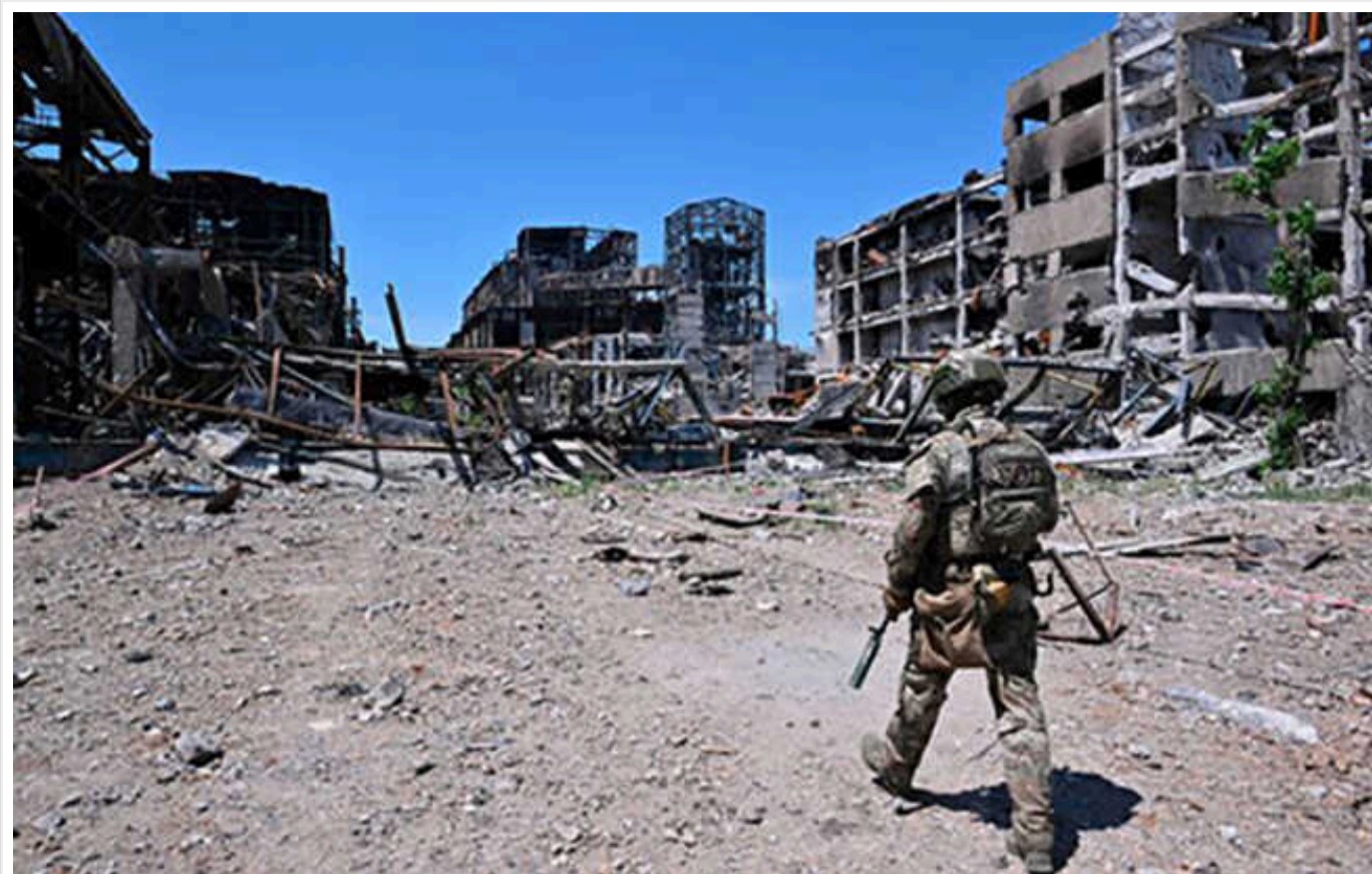
Bloomberg: Відновленн України обійдеться в 1 трильйон доларів, уже є приблизний план

Хоча війна ще не завершена, керівники західних країн, а також державні та приватні компанії, вже розробляють плани повоєнної відбудови України та очікують найбільшого контракту з часів щонайменше Другої світової війни.