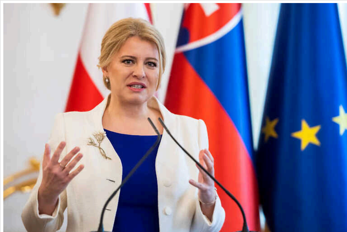
Президентка Словаччини Чапутова розкритикувала Роберта Фіцо

Президентка Словаччини Зузана Чапутова піддала критиці дії прем'єра країни Роберта Фіцо, зазначивши, що той "випробовує межі демократії".