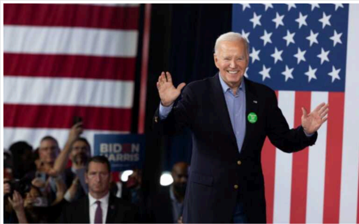
Трамп та Байден одночасно відвідали штат Джорджія у межах виборчої кампанії

Президент Джо Байден і колишній очільник США Дональд Трамп вдруге за рік здійснили візити у межах виборчої кампанії до одного і того самого штату.