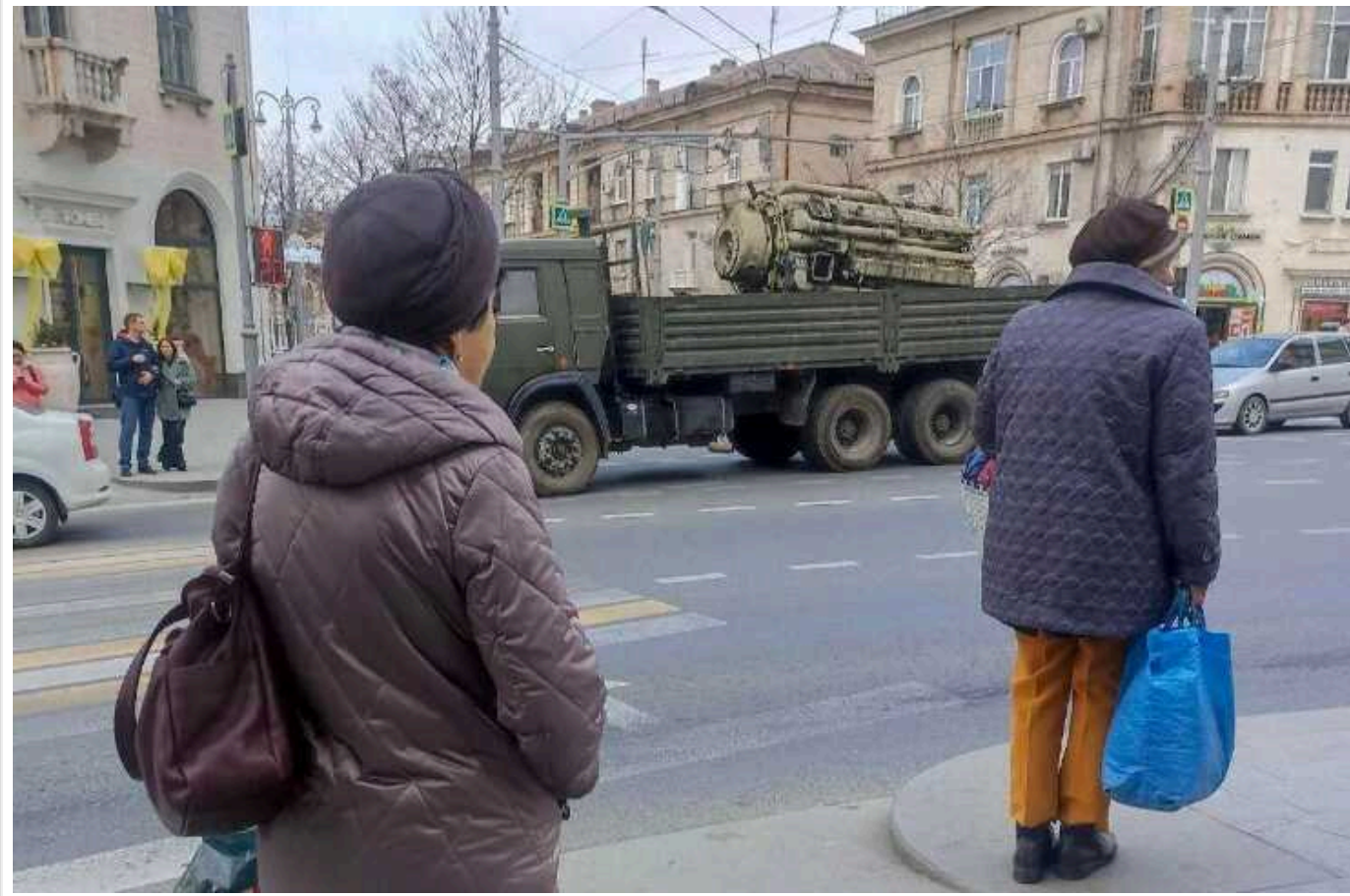
Загарбники переносять ремонтні бази кораблів із захопленого Криму до РФ, – «АТЕШ»

Російські окупанти змушені переносити ремонтні бази кораблів із захопленого Криму на територію РФ. Партизани півострова зафіксували регулярні перевезення корабельних двигунів у бік Тамані.