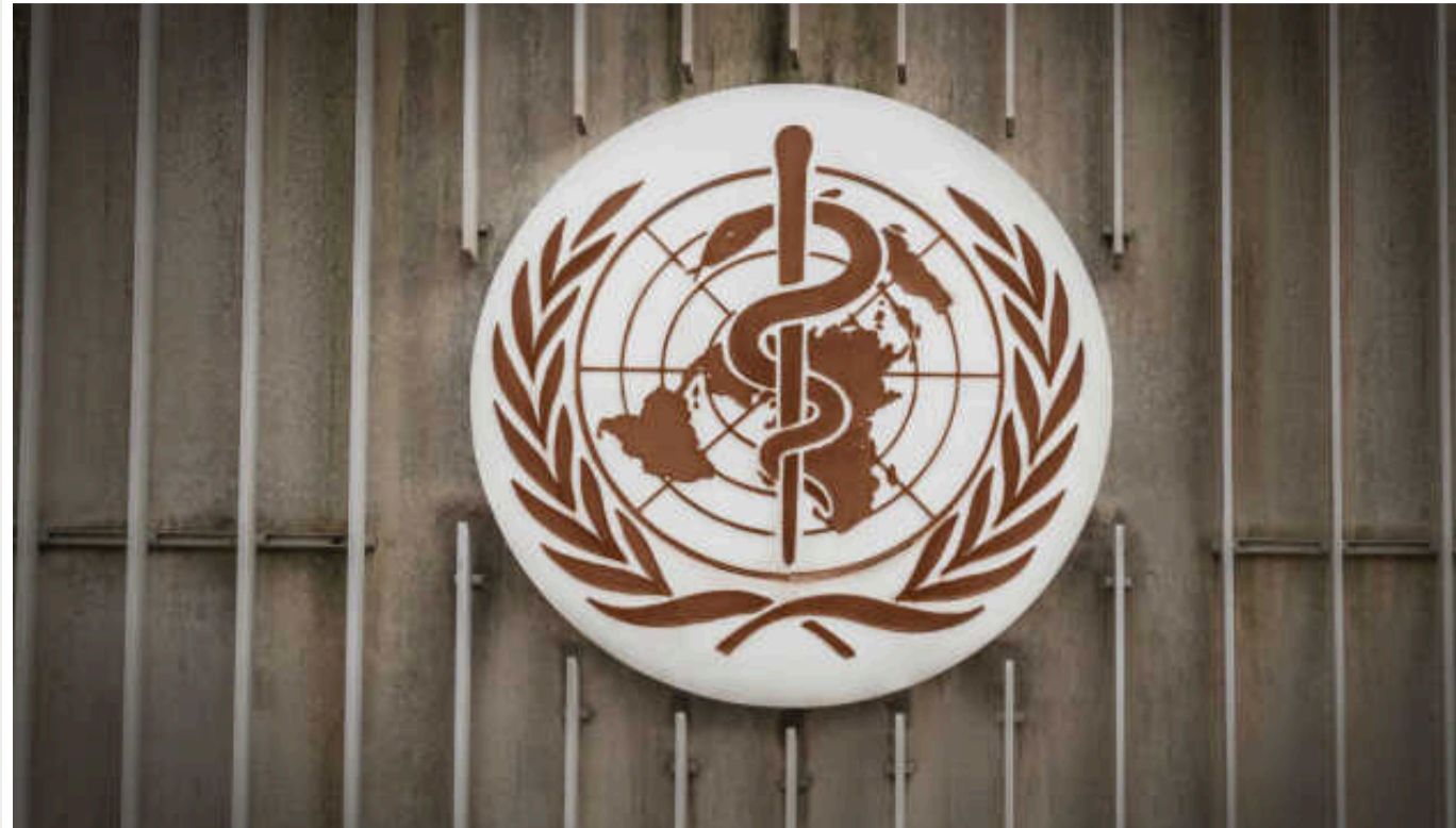
У Китаї заявили, що ризики глобального поширення «хвороби Х» зростають

У Китаї заявили про зростання ризику пандемії "хвороби Х", яка, за даними ВООЗ, може стати наступною глобальною загрозою після коронавірусу. Пекін має намір спиратися на досвід боротьби з COVID-19 і активно готуватися до майбутніх подібних пандемій.