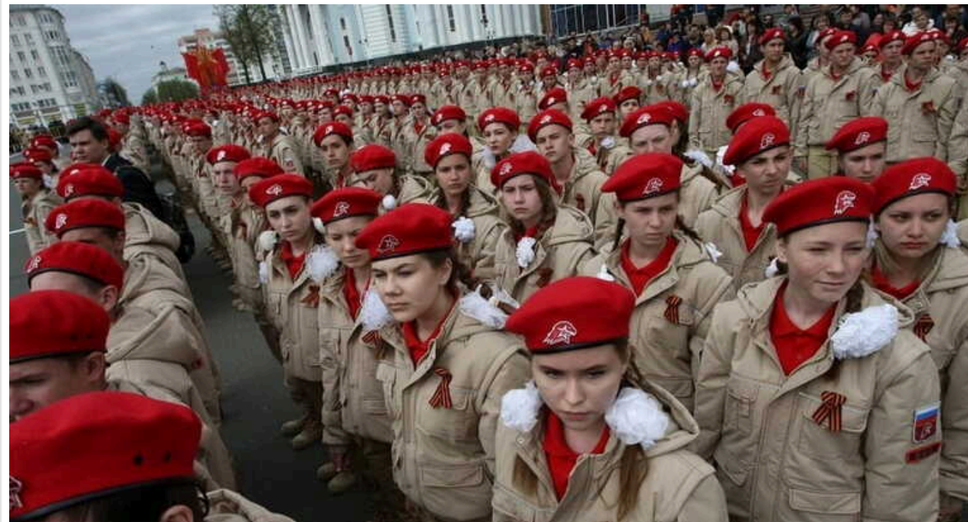
Росіяни в окупованому Криму мілітаризують підлітків, обіцяють «преференції», – ЦНС

Російські загарбники продовжать кампанію з мілітаризації молоді у тимчасово окупованому Криму. Агресор проводить пропагандистські заходи у школах та технікумах на території українського півострова.