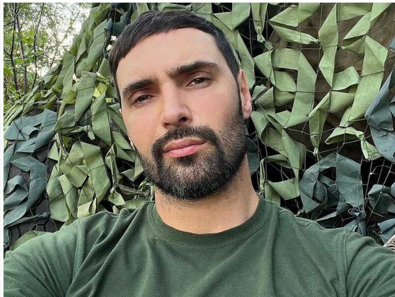
Артист Козловський вперше стане батьком, – ЗМІ

Невдовзі після новини про одруження Віталія Козловського в Мережі з'явилися нові подробиці з його особистого життя. ЗМІ повідомляють, що артист незабаром стане батьком.