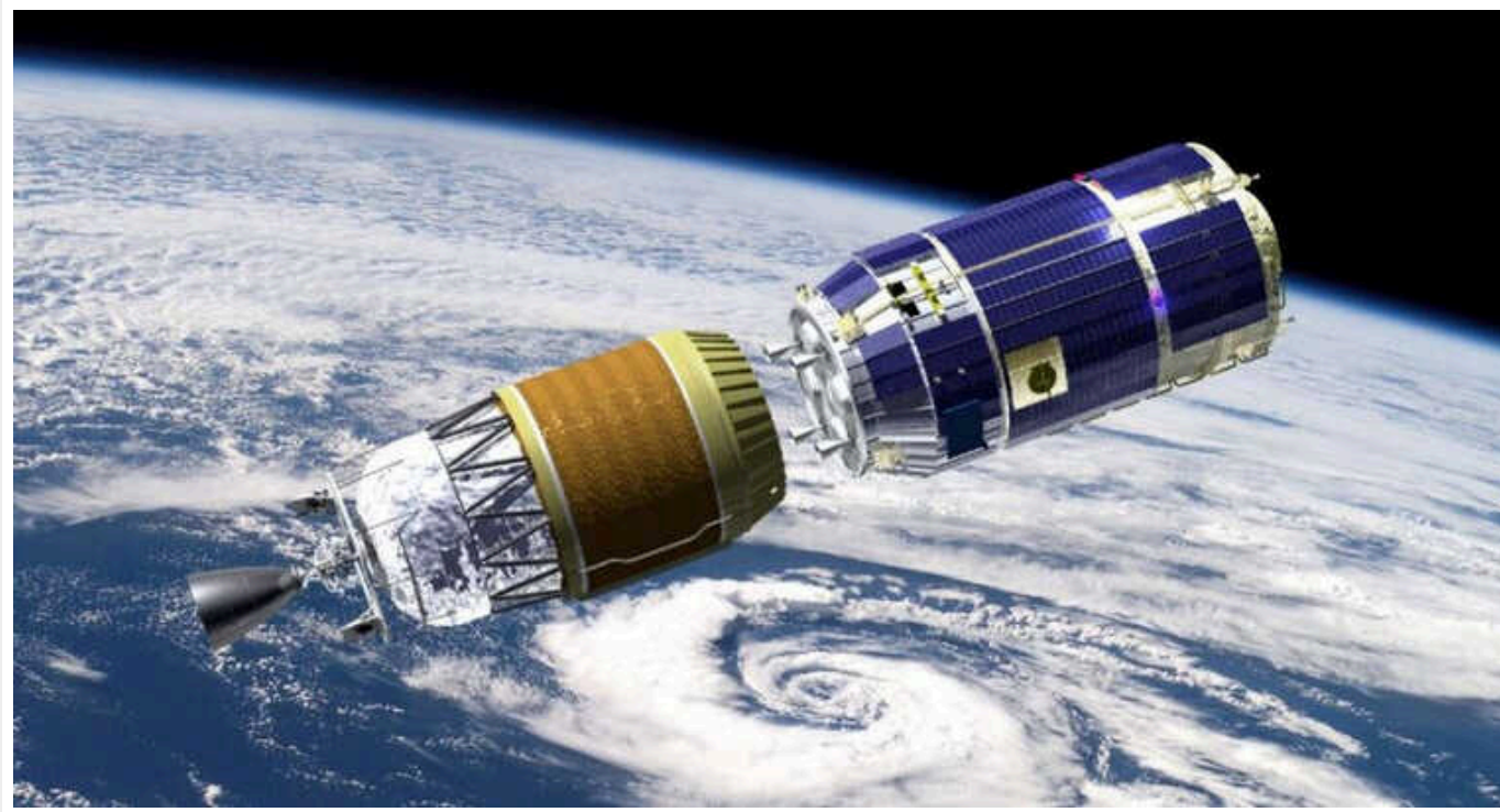
В Японії не вдалося запустити першу приватну космічну ракету

Запланований запуск першого в Японії приватного космічного апарату компанії Space One був скасований у суботу 9 березня через корабель, який увійшов у небезпечну зону нижче за дальністю польоту.