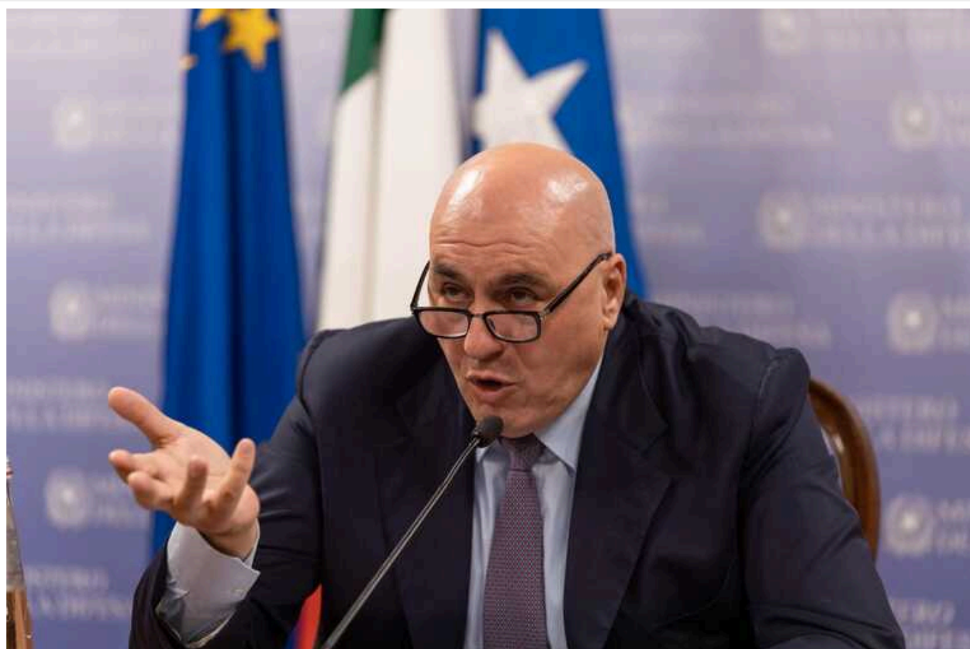
Міністр оборони Італії Гвідо Крозетто розкритикував заяви Франції та Польщі щодо можливості відправлення військ країн НАТО до України

Франція і Польща не можуть говорити від імені НАТО, яке від початку формально і добровільно не втручалося в конфлікт.