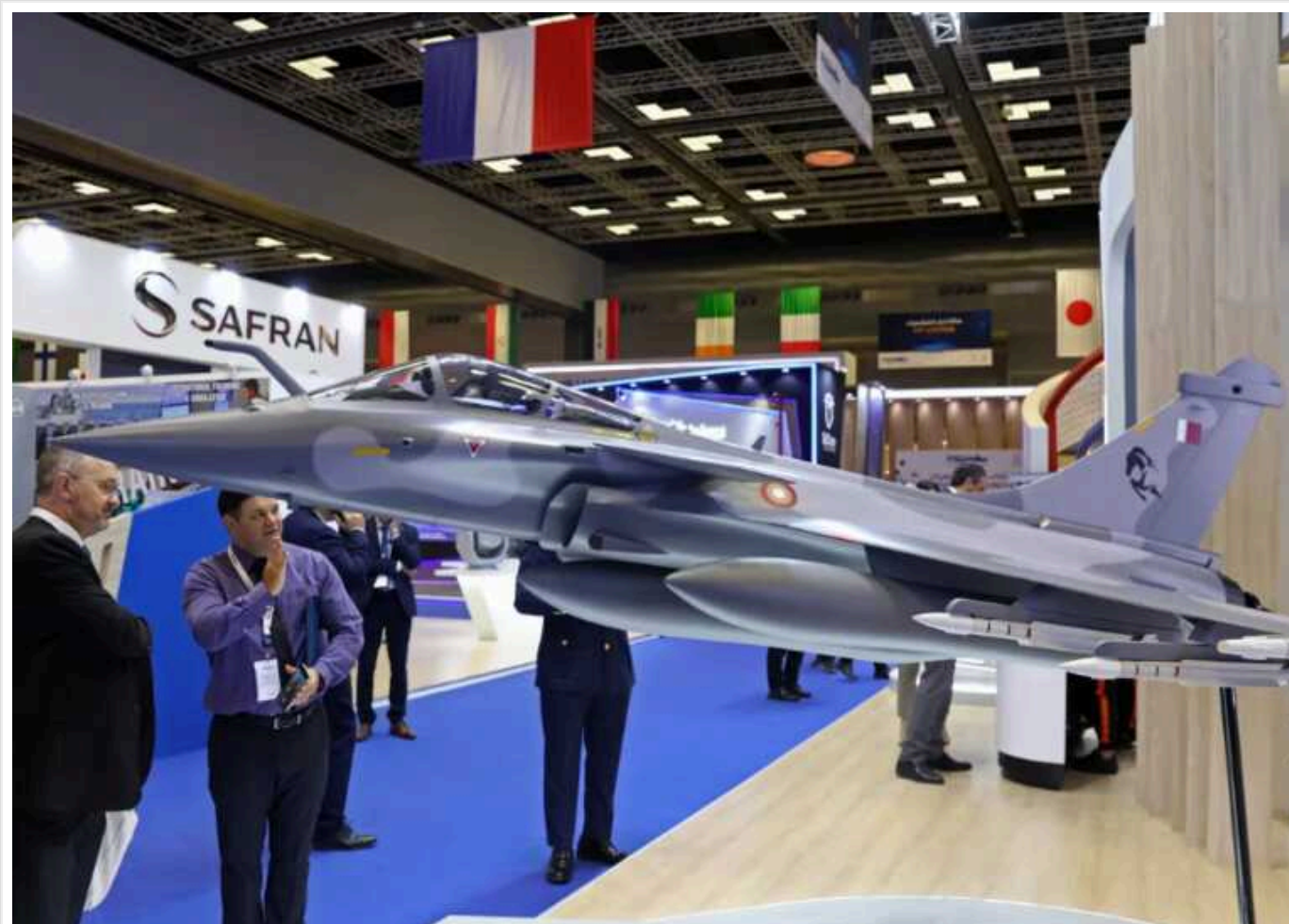
Росія, Іран та Талібан запрошені на виставку озброєння в Катарі, що номінально є союзником США, – Fox News

Цього тижня Іран з'являється на виставці зброї в Катарі, забезпечивши для Тегерана високу платформу для реклами своїх військових можливостей, хоча Доха продовжує підтверджувати оборонне та стратегічне партнерство зі Сполученими Штатами.