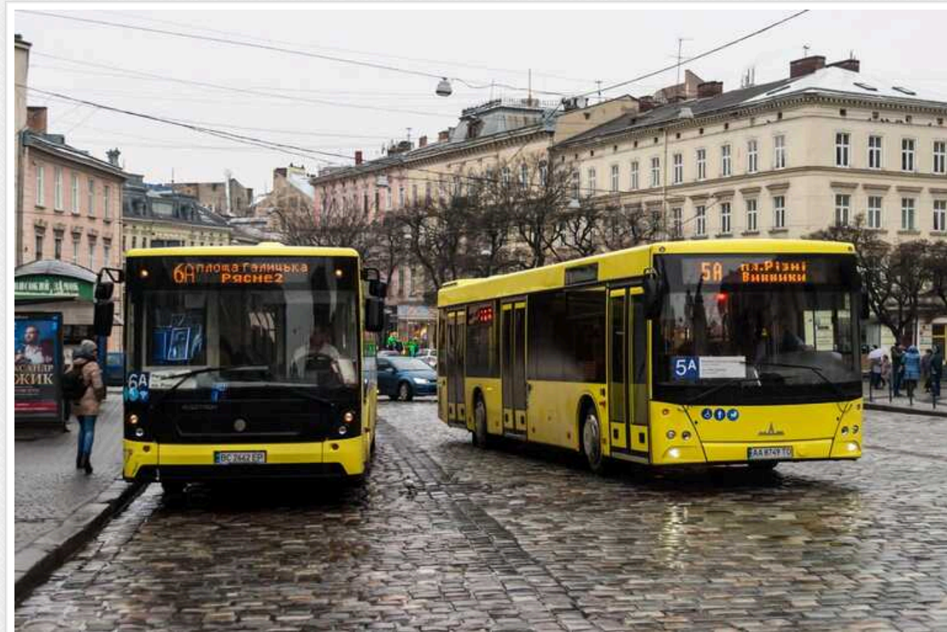
"Переселенці не люди, ви війну привели": у маршрутці Львова стався конфлікт

У Львові місцеві пабрики оприлюднюють відео, на якому пасажирка маршрутки ображає переселенку.