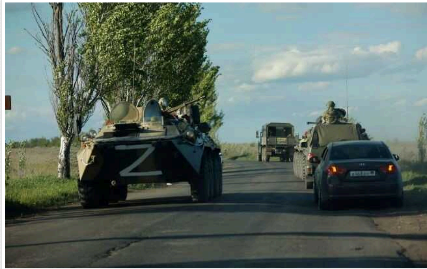
РФ зняла зі збереження до 40% старих танків: в ISW вказали на проблеми агресора з ВПК

Росія вивела із відкритих сховищ від 25 до 40 відсотків своїх стратегічних резервів танків, залежно від моделі. Якщо рівень втрат її техніки у війні проти України залишиться таким, як зараз, або зростає, країна зіткнеться з нестачею обладнання.