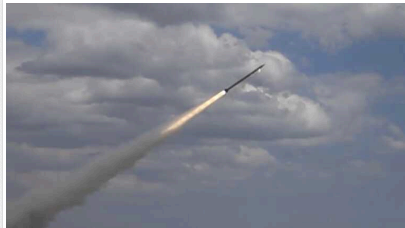
Окупанти вдарили по Дніпропетровщині: є "прильоти" у підприємство й інфраструктурний об'єкт, виникли пожежі

Окупаційні війська Росії в ніч на 10 березня завдали ракетного й дроневого удару по Дніпропетровській області та обстріляли її з артилерії. Внаслідок цього виникли пожежі та є пошкодження на підприємстві й інфраструктурному об'єкті.