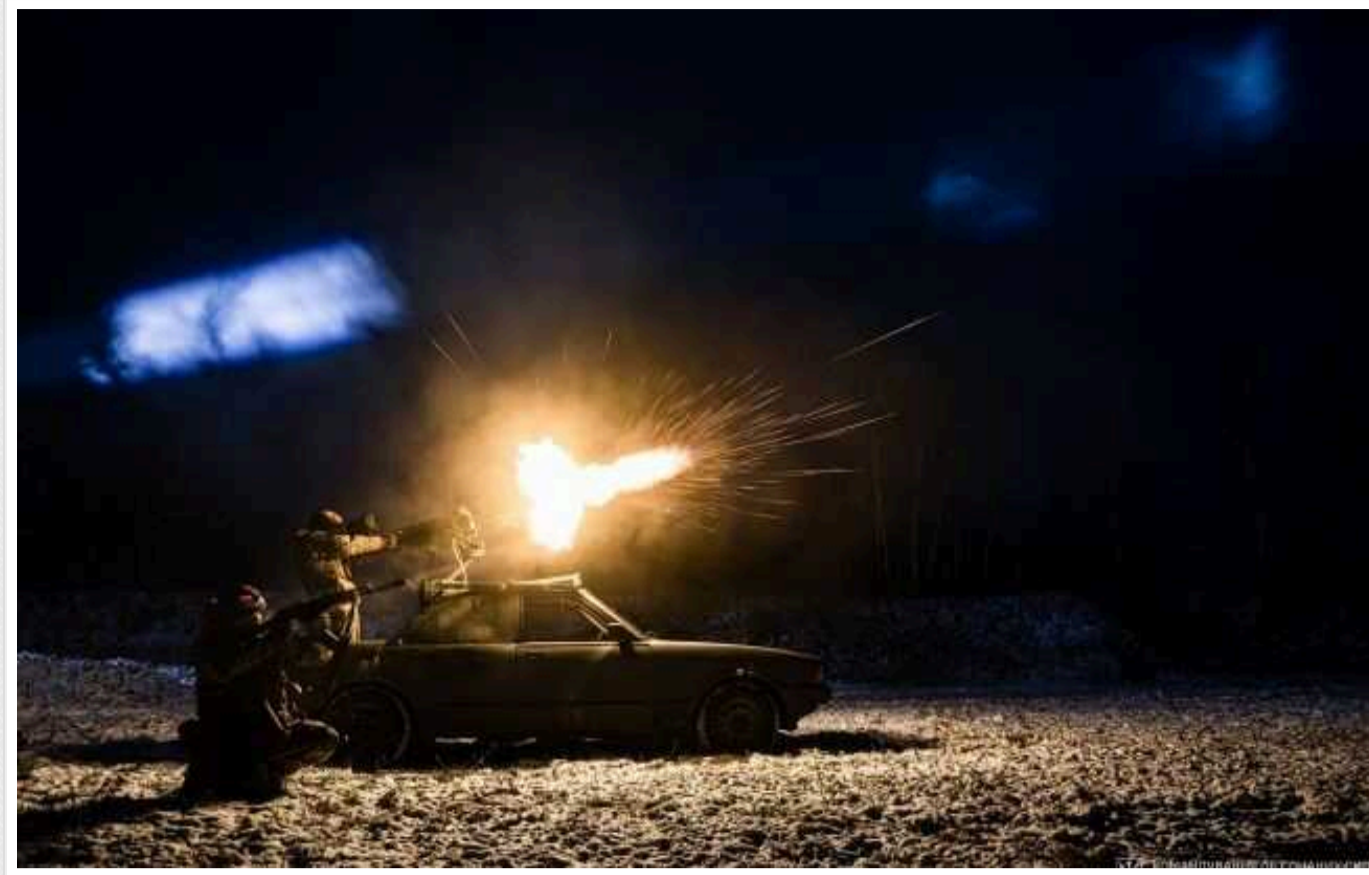
Атака "Шахедів": в Одесі та Миколаївській області прогрімili вибухи, працює ППО

В Одесі та Снігурівці Миколаївської області ввечері 9 березня пролунали вибухи під час повітряної тривоги через ворожу атаку із застосуванням дронів-камікадзе типу "Шахед".