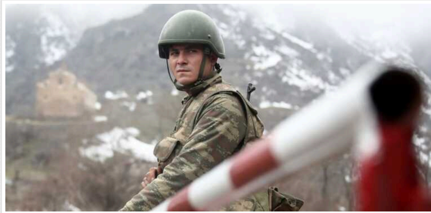
Азербайджан вимагає від Вірменії звільнити чотири села

Видання Report з посиланням на прес-службу заступника прем'єр-міністра Азербайджану Шахіна Мустафєєва пише, що влада Азербайджану зажадала від Вірменії звільнити чотири неексклавні села, а також ставлять питання по ще чотирьох ексклавних (відокремлених від основної території Азербайджану) селлах.