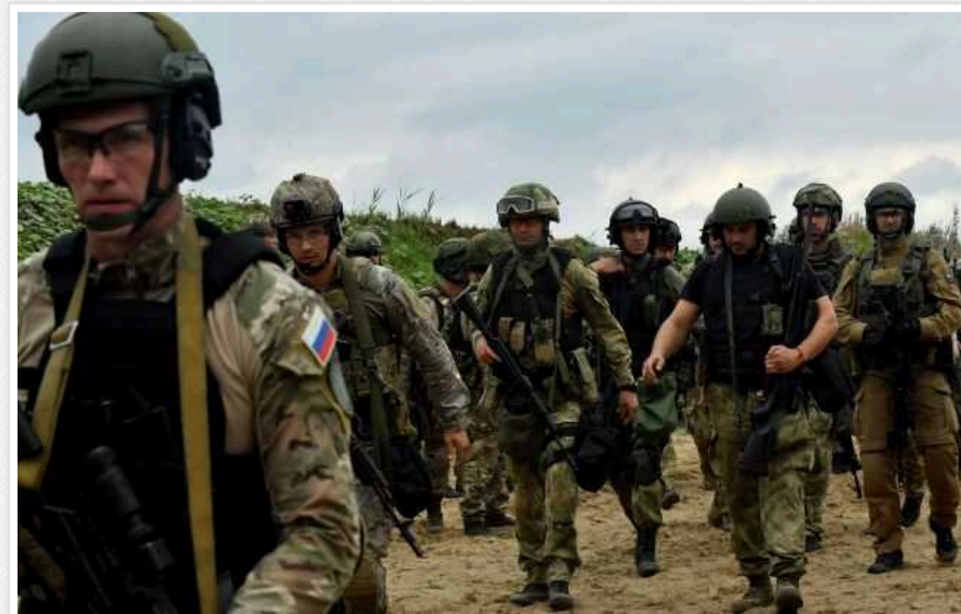
Втрачали по 1000 людей на день: наступ ЗС РФ під Авдіївкою заглинувся, – New York Times

Після швидких успіхів просування російської армії пригальмувалося, а висока інтенсивність штурмів, яка була після захоплення міста, поступово звелася нанівець, пише видання.