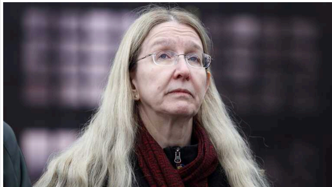
Уляна Супрун звинуватила активістів-антикорупціонерів у тому, що Захід не дає Україні зброю

Супрун зазначає, що своїми діями ці активісти лише підсилювали російську пропаганду, яка велася в західних країнах багато років і заклала недовіру до українців.