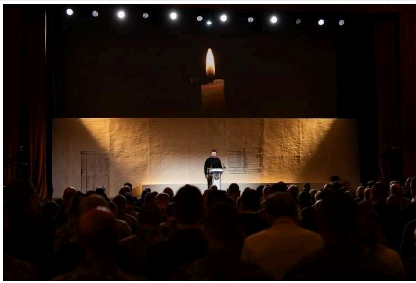
Зеленський на врученні Шевченківської премії вшанував пам'ять загиблих митців: «Україна буде завжди»

Президент Володимир Зеленський та перша леді Олена Зеленська в суботу, 9 березня, взяли участь у врученні Національної премії імені Тараса Шевченка 2024 року, якою нагороджують за вагомий внесок у розвиток культури та мистецтва України. Під час церемонії глава держави вшанував пам'ять загиблих на війні митців та подякував тим, хто нині боронить Батьківщину.