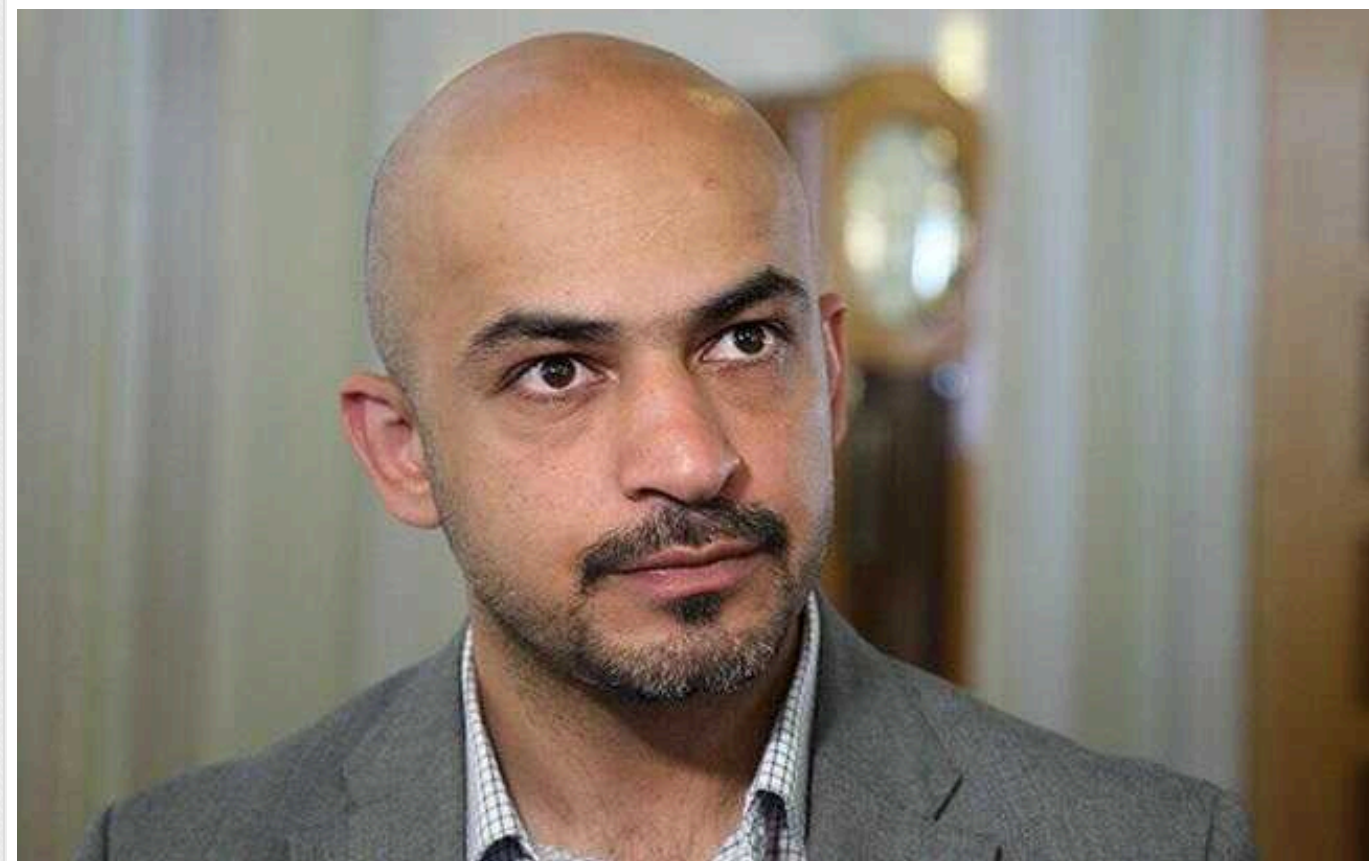
«У нас є шанс відбудувати Україну краще, ніж це було в СРСР», – Мустафа Найєм

Про це пише видання Bloomberg, посилаючись на главу Держагентства відновлення та розвитку інфраструктури Мустафу Найєма.