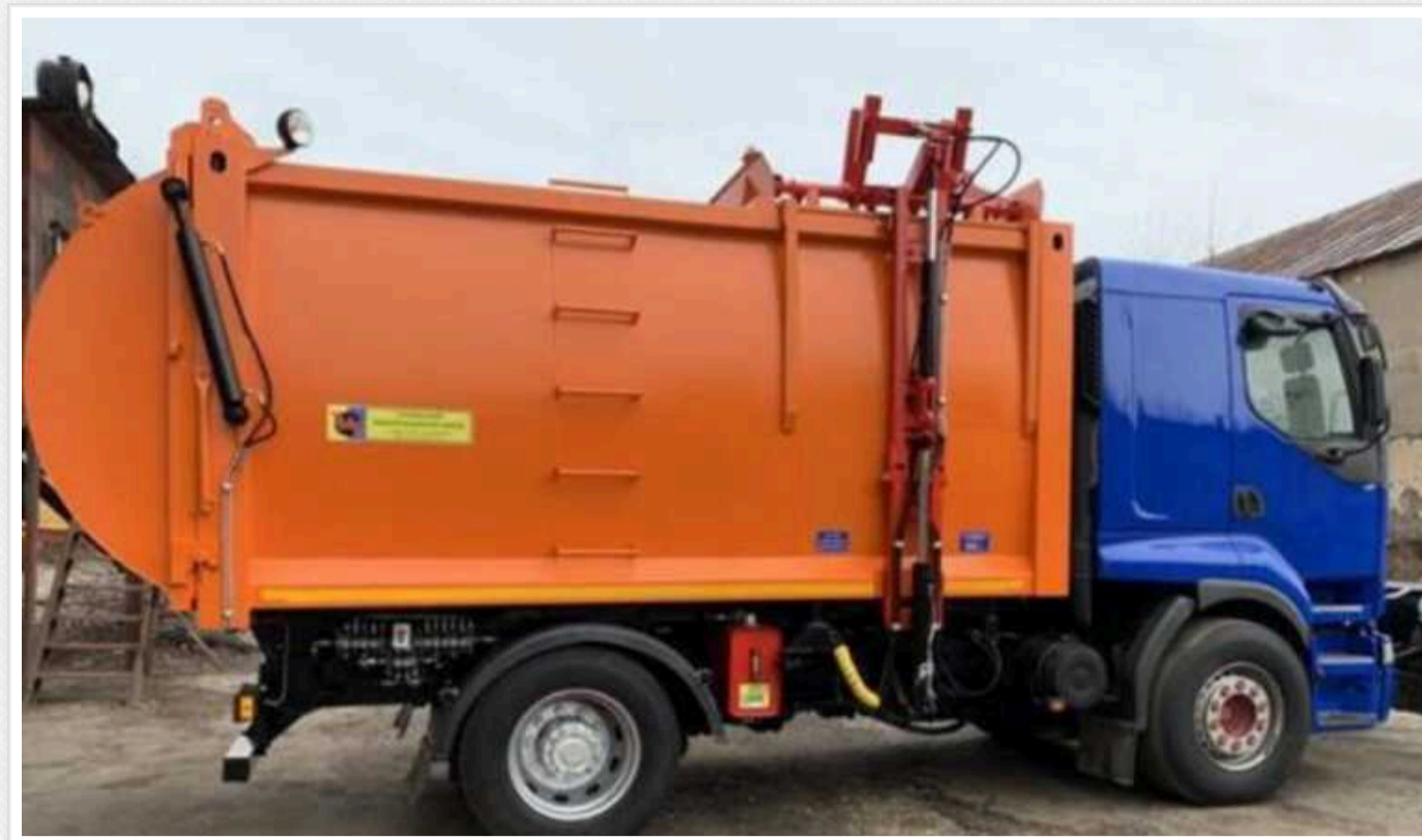
На Львівщині судитимуть посадовців за фіктивну закупівлю сміттєвоза за понад 500 тисяч гривень

На Львівщині прокурори скерували до суду обвинувальний акт стосовно колишнього директора комунального підприємства та директора товариства за фактами заволодіння чужим майном та службового підроблення, вчинених за попередньою змовою групою осіб.