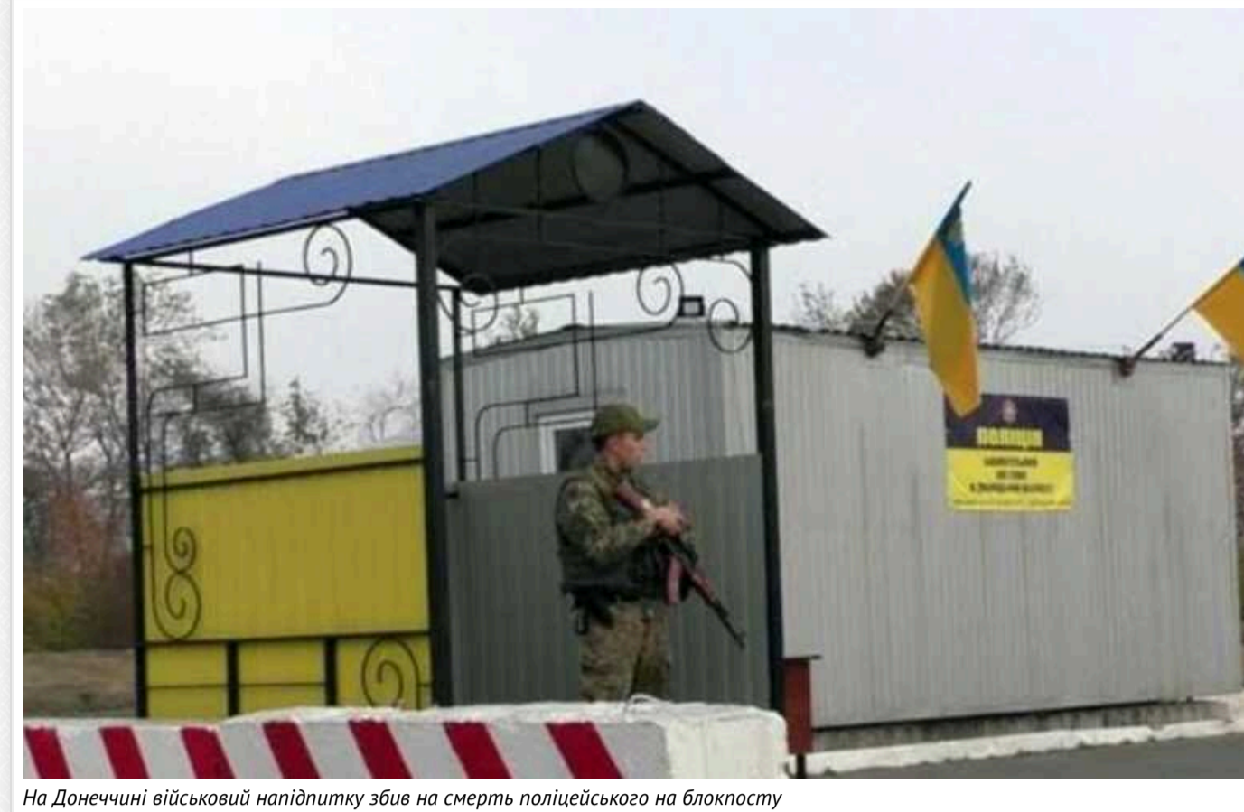
На Донеччині військовий нападитку збив на смерть поліцейського на блокпосту

Про це повідомили джерела ЗМІ у правоохоронних органах.