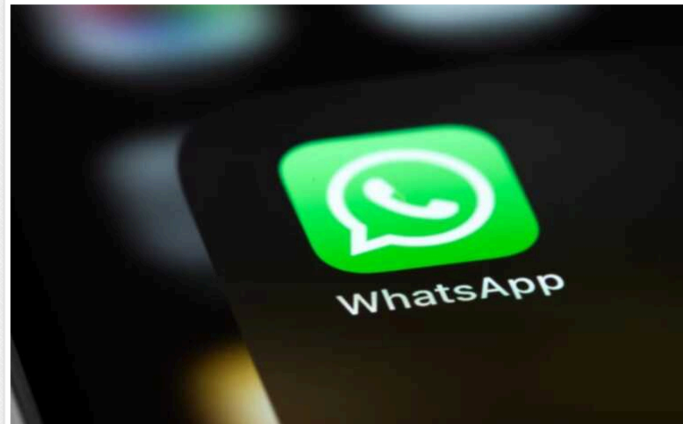
У Пакистані студента засудили до страти за "богохульське" повідомлення у месенджері

У Пакистані суд присудив смертну кару 22-річному студенту, звинуваченому у богохульстві. Ще один юнак за такий злочин отримав довічне ув'язнення.