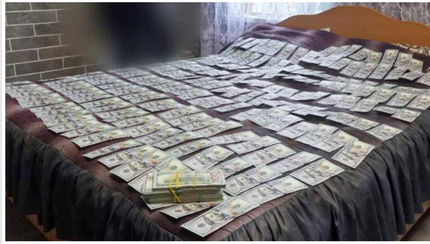
У столиці затримали банду "криптовалютних арбітражників"

Двоє мешканців Київської та семеро людей з інших областей, були затримані за поширення через ТГ-канали пропозицій про заробіток на криптовалютах та організацію двох call-центрів під Києвом.