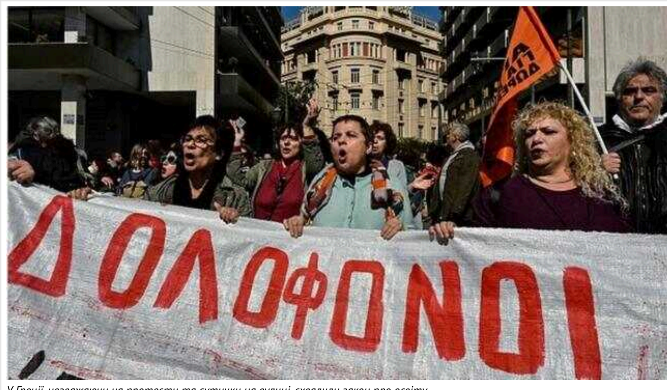
У Греції, незважаючи на протести та сутички на вулиці, схвалили закон про освіту

Грецькі законодавці вчора схвалили масштабні реформи в освіті, що дозволяють іноземним приватним університетам відкривати філії у країні та через який виникли масштабні протести.