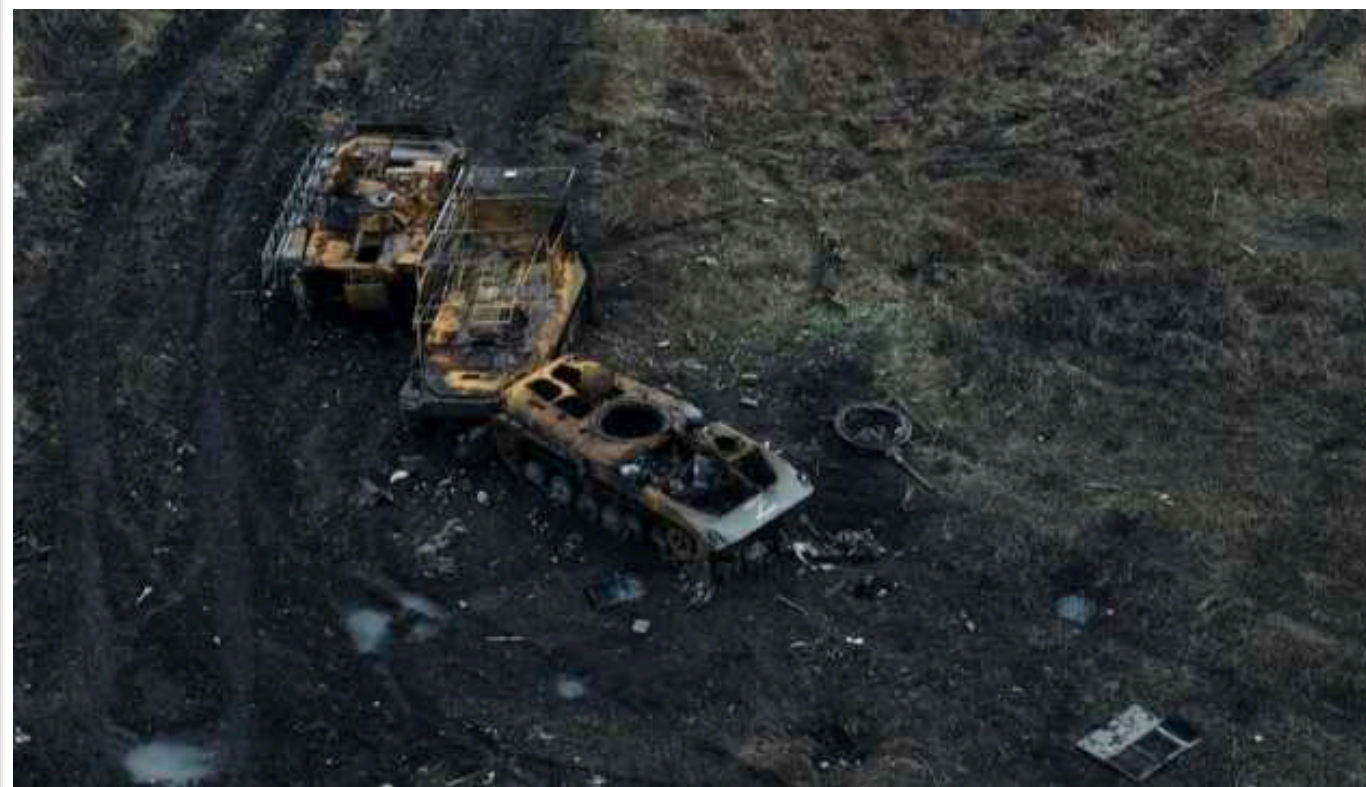
Втрати на фронті: російська армія втратила вже 423 160 загарбників

Загальні бойові втрати армії Російської Федерації в Україні з 24 лютого 2022 року по 9 березня 2024 року становлять близько 423 тисяч 160 загарбників, зокрема 850 осіб - за минулу добу.