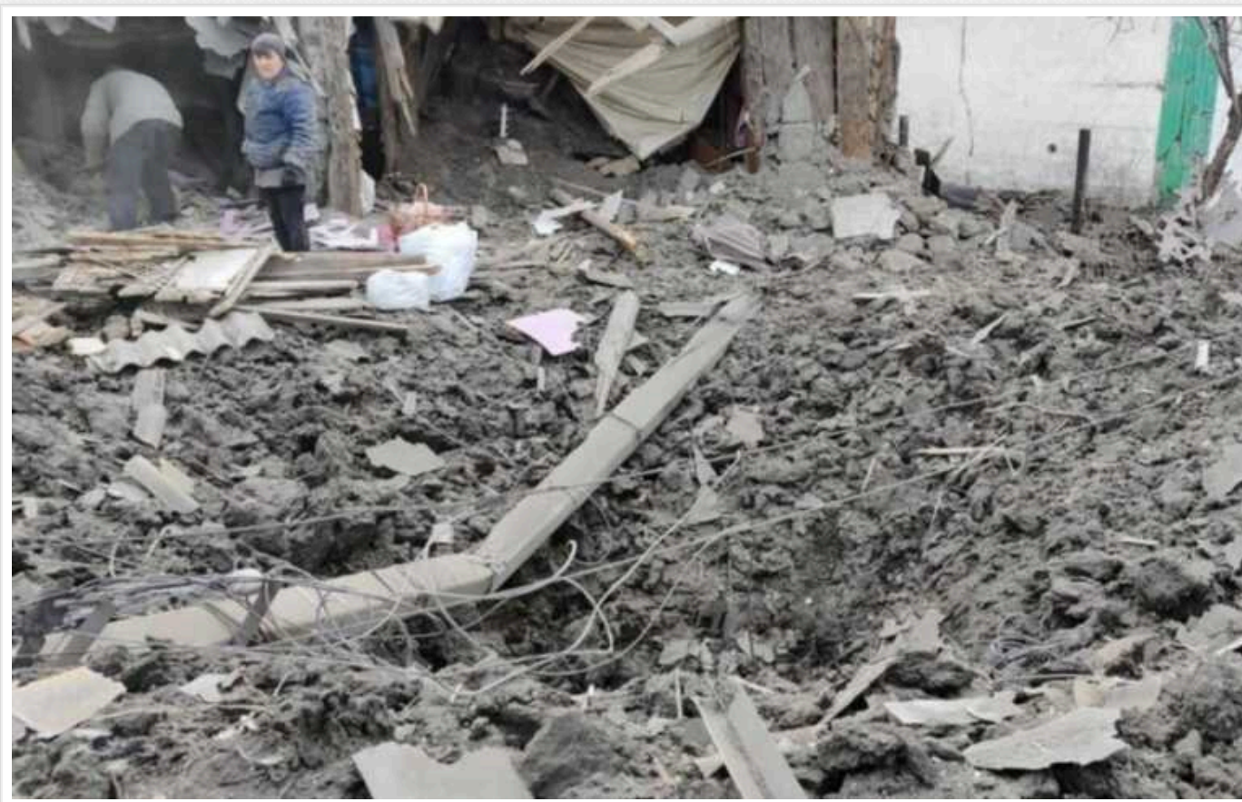
Окупанти за добу поранили на Донеччині дев'ять мирних жителів

Російські війська за минулу добу поранили ще дев'ять мирних жителів Донецької області.