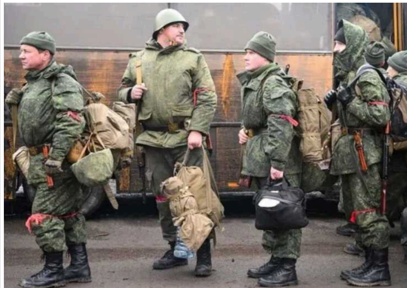
В окупованому Донецьку – дефіцит громадського транспорту: через "мобілізацію" не вистачає водіїв

У тимчасово окупованому Донецьку продовжує скорочуватися мережа громадського транспорту. Через тотальну "мобілізацію" у захопленому росіянами місті не вистачає водіїв.