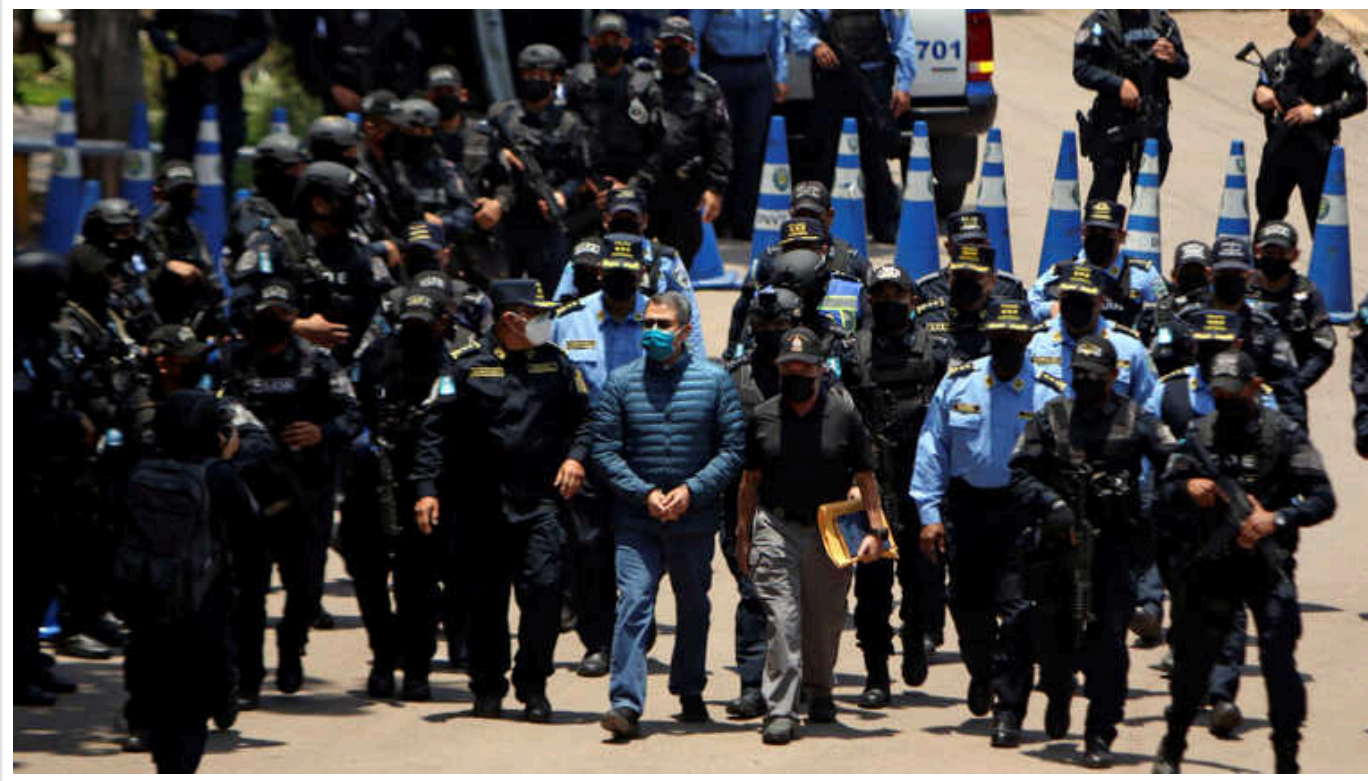
Експрезидента Гондурасу визнали винним у злочинах, пов'язаних із наркотиками

Колишнього президента Гондурасу Хуана Орландо Ернандеса у федеральному суді Манхеттена, США, визнали винним у торгівлі наркотиками. Другий пункт звинувачення, за яким політика також було визнано винним – зберігання "деструктивних пристроїв". Мається на увазі зброя, у тому числі кулемети.