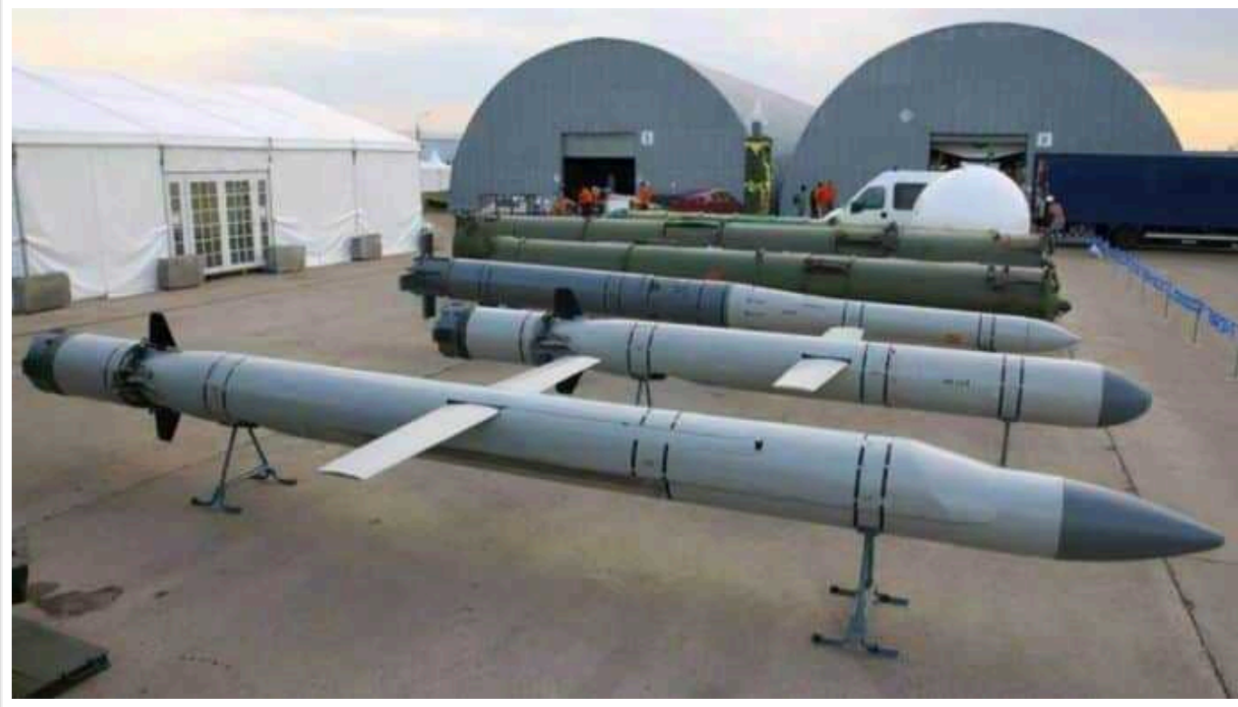
У Росії ракетне виробництво відстає на 6 місяців завдяки "Кібер спротиву", - ЦНС

Сили оборони отримали від активістів "Кібер спротиву" документацію російських виробників ракет: стали відомі фірми-прокладки, через які купували необхідні запчастини для виготовлення зброї.