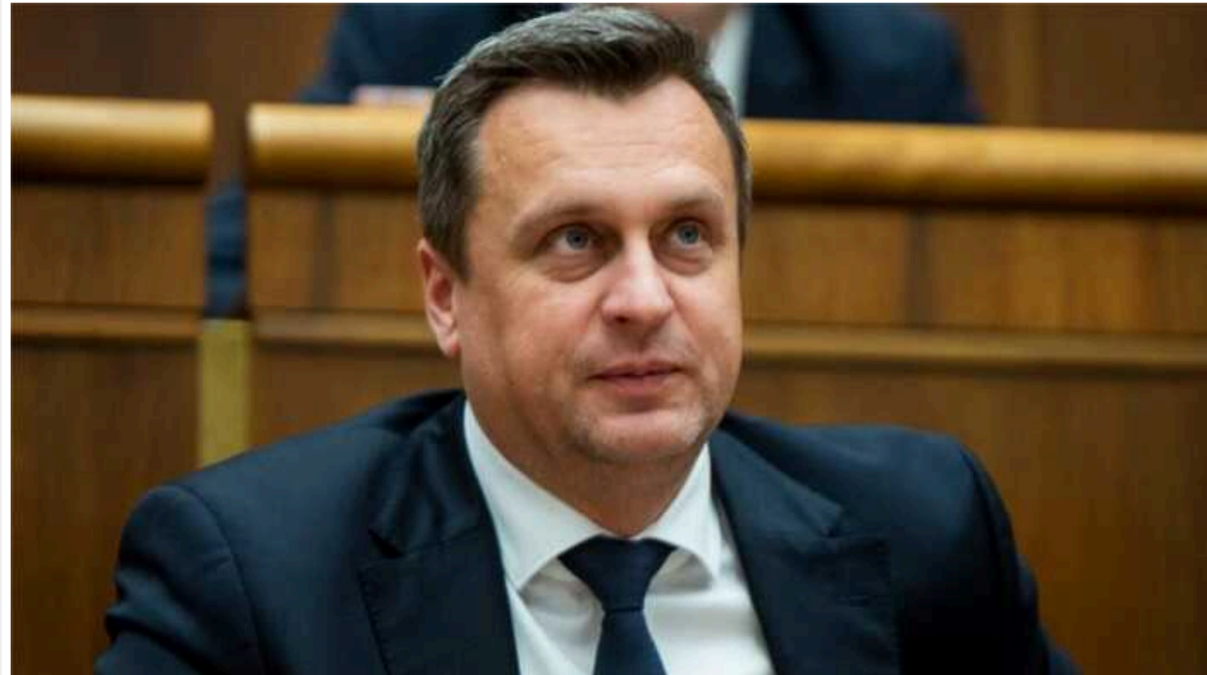
Віцепікер парламенту Словаччини заявив, що не вважає РФ агресором

За словами віцепікера парламенту Андрія Данка, найголовніше завдання Словаччини у війні РФ проти України не стати безпосереднім учасником бойових дій.