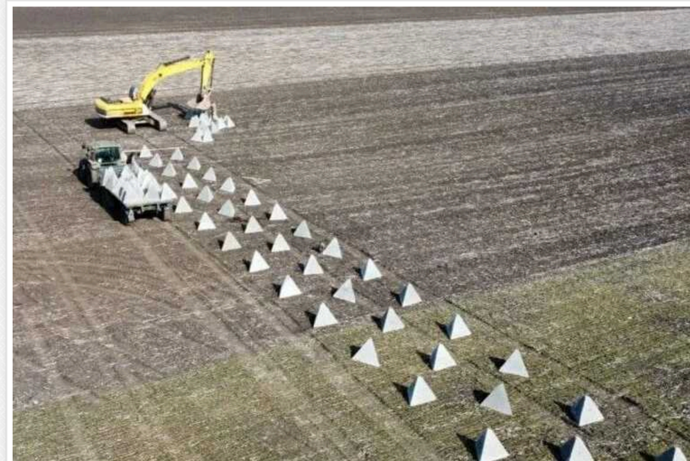
На Дніпропетровщині зводять нову лінію оборони: десятки кілометрів протитанкових ровів, бліндажів і капонірів

На Дніпропетровщині продовжується активне зведення нової лінії оборони. Ці фортифікації включають десятки кілометрів протитанкових ровів, бліндажів і капонірів.