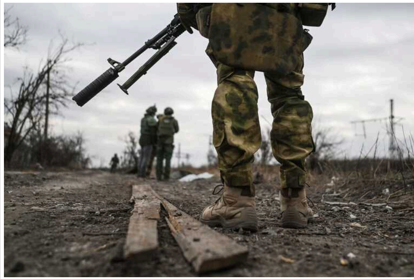
В Індії торгували людьми для відправки на війну в Україну на боці РФ

Видання Indian Express із посиланням на Центральне бюро розслідувань пише, що в Індії розкрили велику мережу торгівлі людьми для відправки на війну в Україну за Росії.