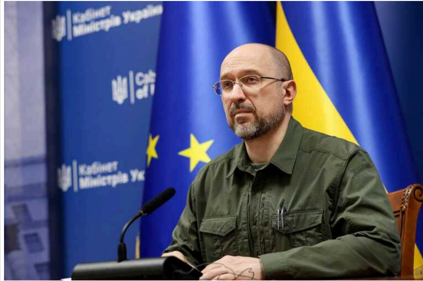
Уряд буде компенсувати 25% від вартості техніки вітчизняного виробництва, – Шмигаль

Уряд затвердив порядок використання коштів на часткову компенсацію аграріям, які купують українську сільгосптехніку.