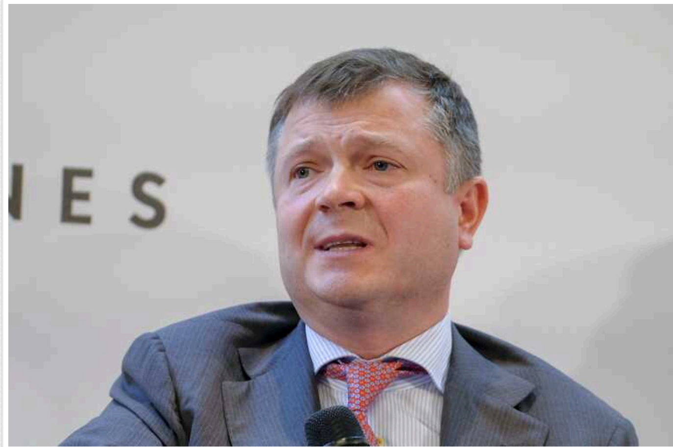
Олігарх Жеваго розбробляє схему по банкрутству Полтавського ГЗК, – ДБР

Олігарх-утікач Костянтин Жеваго планує дискредитаційну кампанію проти ДБР щодо начебто тиску на бізнес аби уникнути відповідальності за спроби довести до банкрутства ПрАТ «Полтавський гірничо-збагачувальний комбінат».