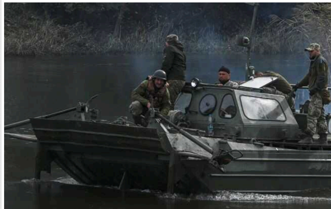
Ситуація на фронті: протягом доби сталося 74 бойові зіткнення

На фронті сталося 74 бойові зіткнення, українські воїни відбили атаки росіян біля Тернів (Донецька область) та вразили склад боєприпасів противника.