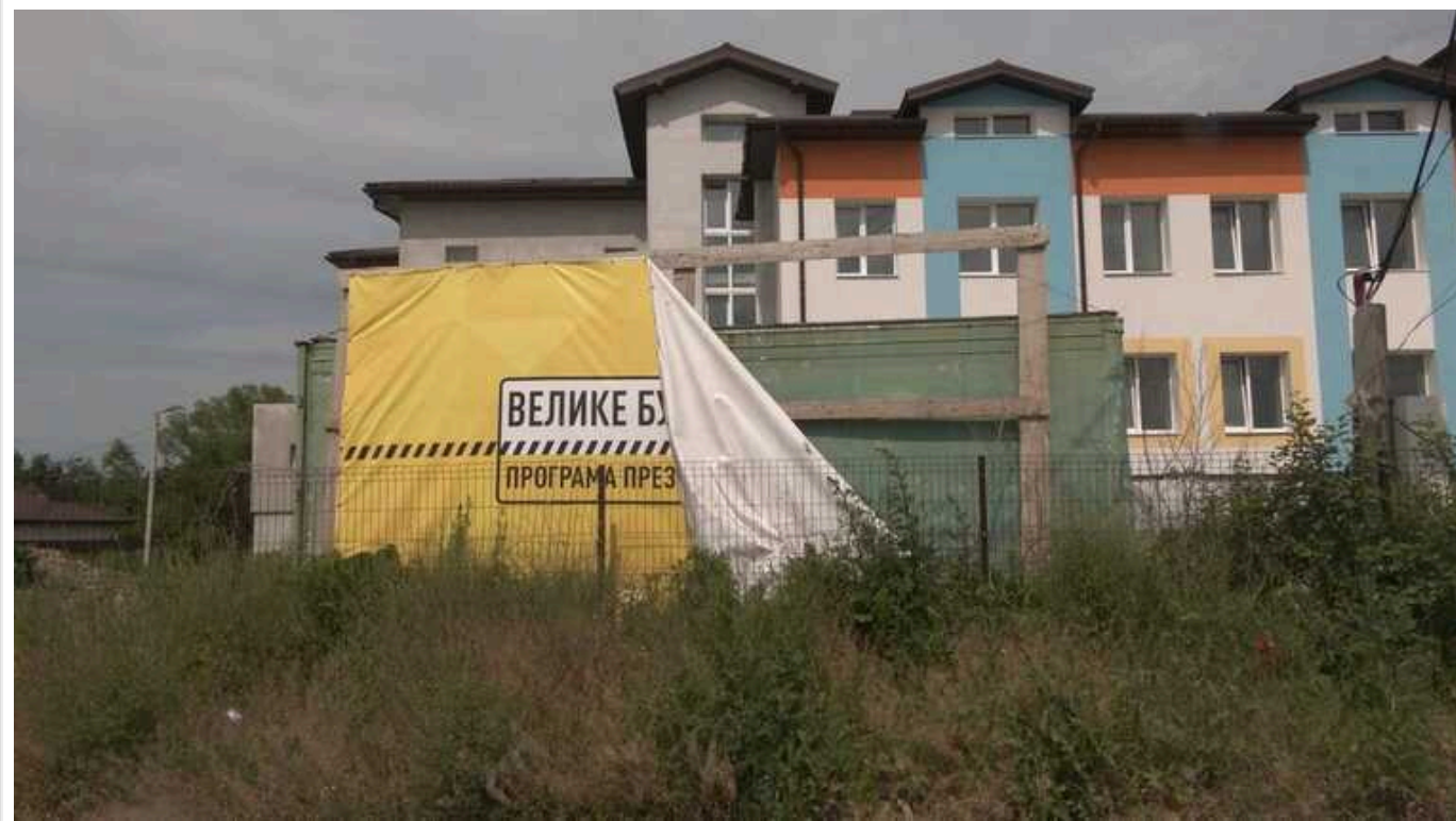
Під час будівництва сільської школи поблизу Івано-Франківська привласнили 14,8 мільйона гривень

Правоохоронці повідомили посадовцю з Прикарпаття про підозру у привласненні бюджетних грошей та службовому підробленні. НАБУ та САП не називають посаду підозрюваного, але вважають, що він у змові з колишнім директором Управління капітального будівництва в Івано-Франківській області та директором будівельної компанії привласнив 14,8 млн грн, які виділили на будівництво навчально-виховного комплексу у селі Чукалівка Тисменицького району.