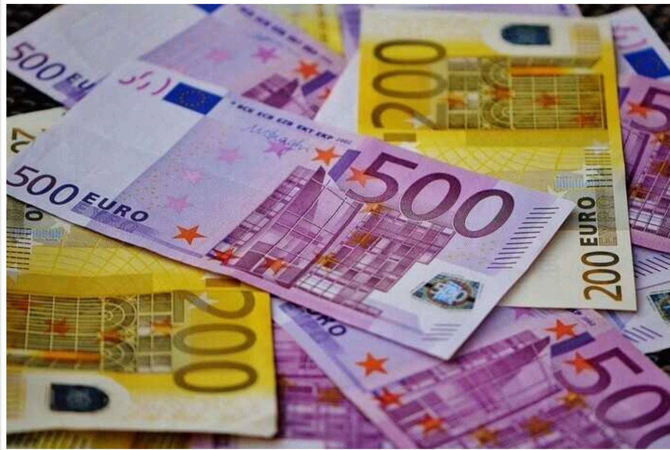
Стартувала рекордна програма допомоги від ЄС: Україна отримає гроші одразу за три місяці

Україна отримає перший транш за рекордною програмою допомоги від Європейського Союзу (ЄС) Ukraine Facility вже у березні 2024 року. До кінця місяця на рахунки України надійде 4,5 млрд євро, які допоможуть збалансувати держбюджет. Цей транш, по суті, включатиме три "грошові перекази" відразу – по 1,5 млрд євро за кожен місяць з початку 2024 року (січень, лютий і березень).