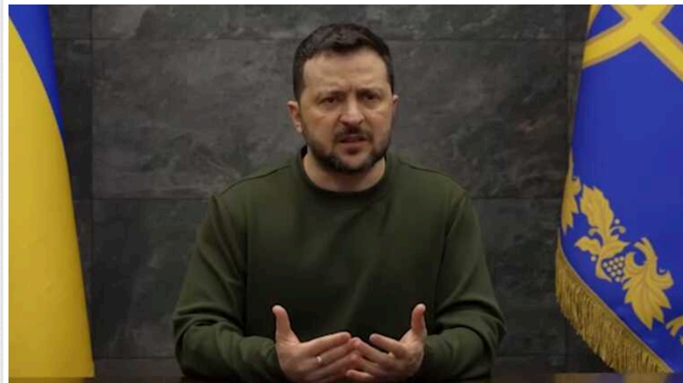
Зеленський пояснив, чому не можна допустити "замороження" війни в Україні

Замороження війни в Україні стало би для нашої держави серйозним викликом і великою проблемою. Адже припинення активних бойових дій означало би не паузу у війні, а можливість перепочинку для російського президента Володимира Путіна та його військ.