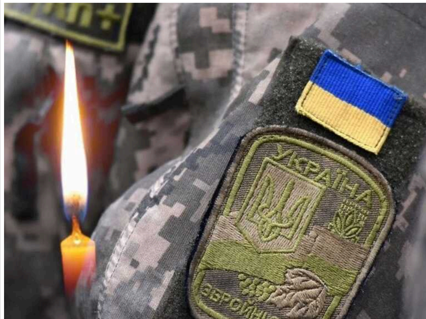
Правоохоронці розслідують вже 45 фактів убивств українських військовополонених

Від початку повномасштабного вторгнення станом на березень 2024 року українські правоохоронці задокументували і розслідують 45 фактів убивств військовополонених.