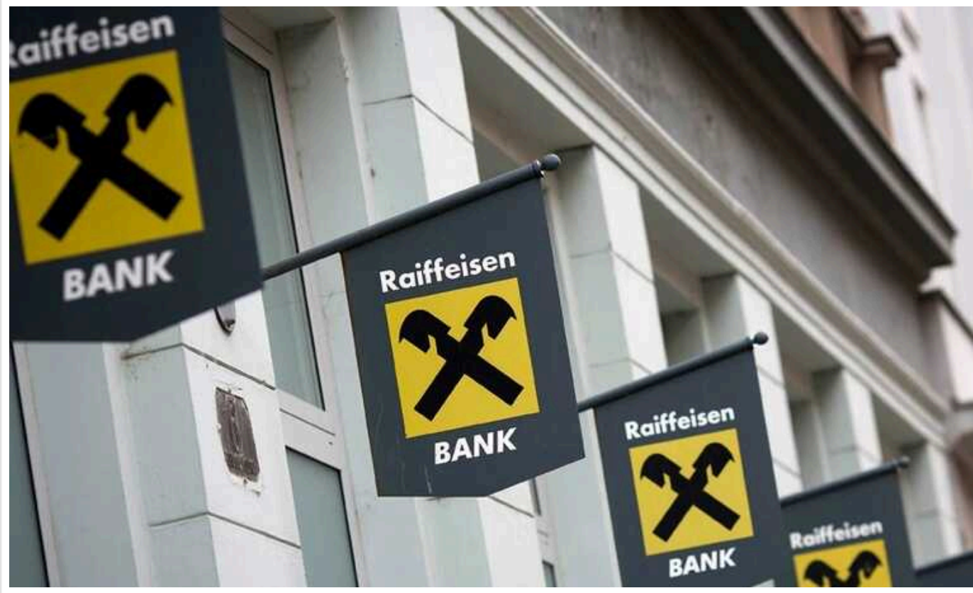
США тиснуть на Австрію та Raiffeisen Bank через співпрацю з РФ

США посилюють тиск на австрійський Raiffeisen Bank через його роботу в Росії. Зокрема, делегація Мінфіну США попередить австрійських чиновників та представників банку про ризики подальшої роботи у РФ.