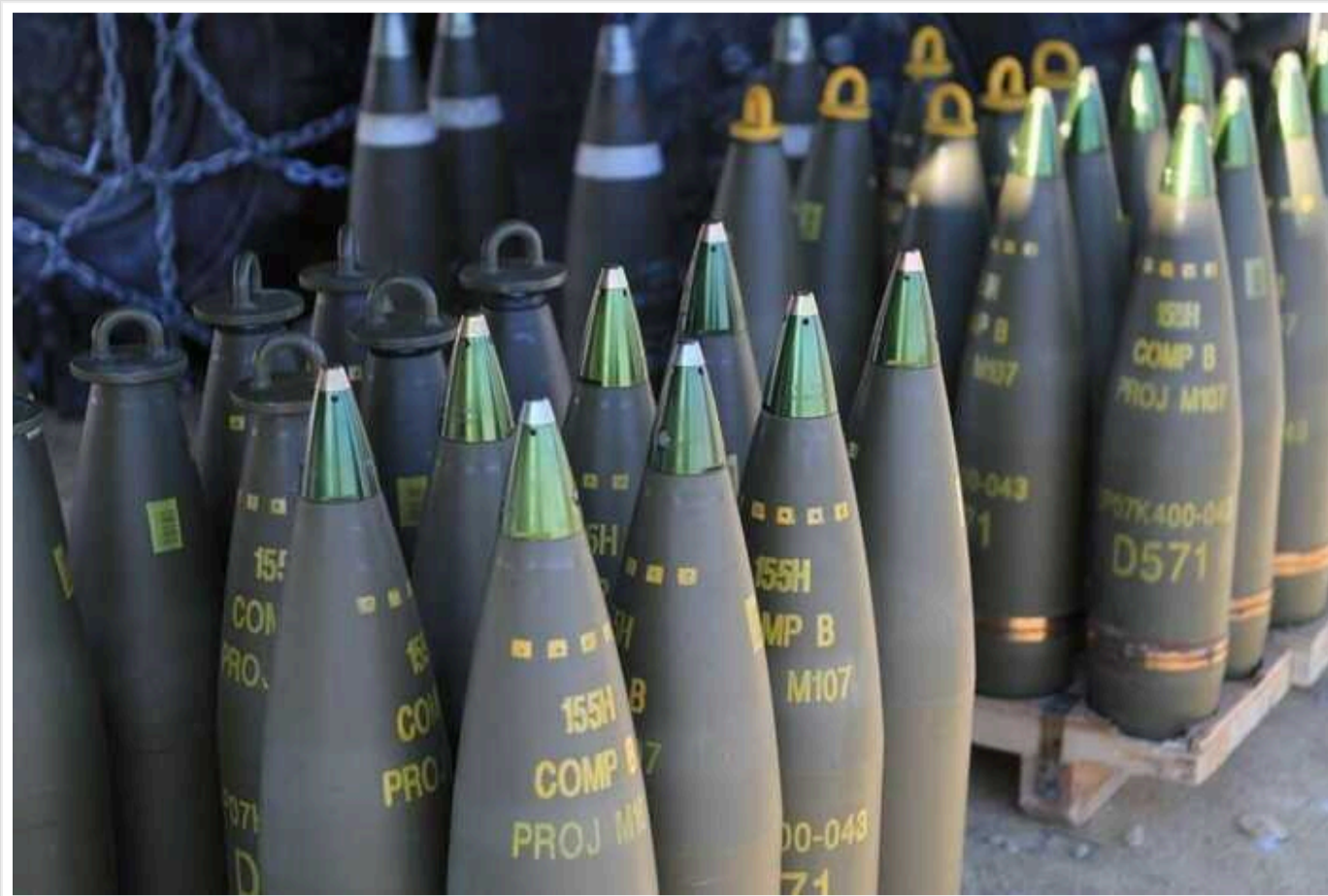
У Чехії спростували слова президента Петра Павела, що Прага вже збрала всю суму для закупівлі артилерійських снарядів для ЗСУ