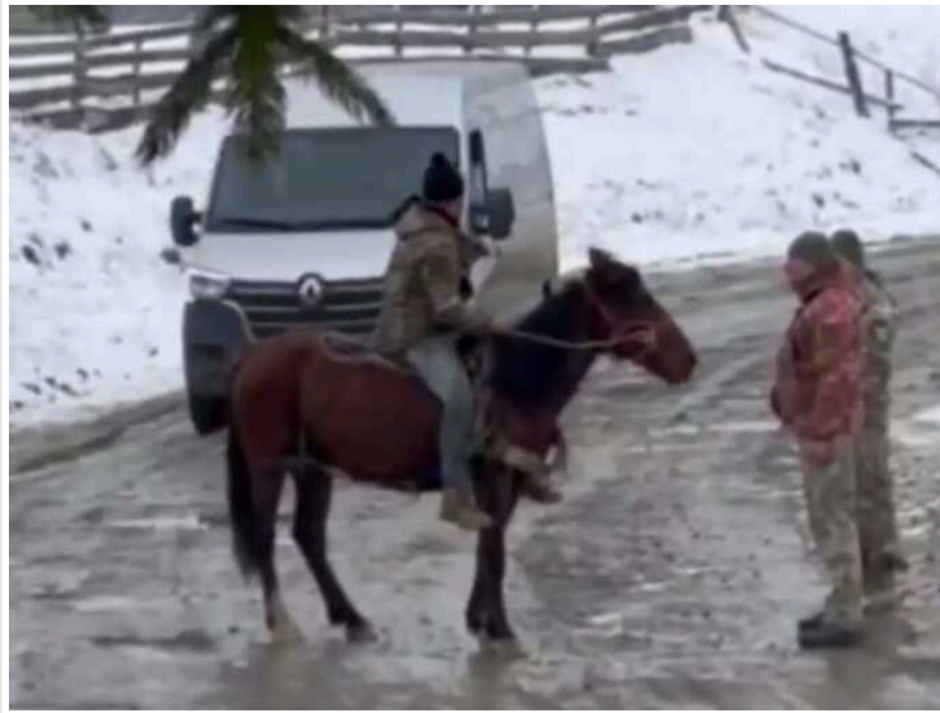
Стали відомі причини нападу чоловіка із сокирою на співробітників ТЦК у Чернівецькій області