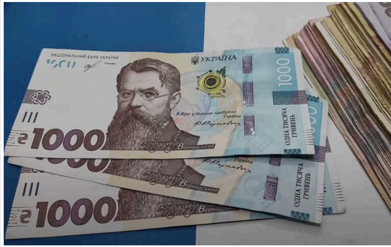
Підвищені штрафи ефективніші, ніж блокування рахунків ухлянтів у законі про мобілізацію, – Чернів

Підвищені штрафи для ухлянтів є більш ефективними, ніж блокування рахунків, як пропонує Кабмін у законопроекті щодо посилення мобілізації.