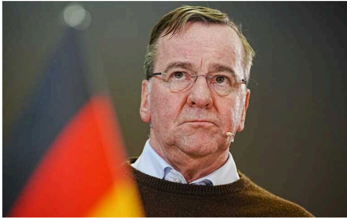
Пісторіус закликав припинити дискусії про розміщення західних військ в Україні

Німеччина відкидає можливість розміщення своїх військ на території України. Берлін закликає припинити дискусії щодо цієї теми.