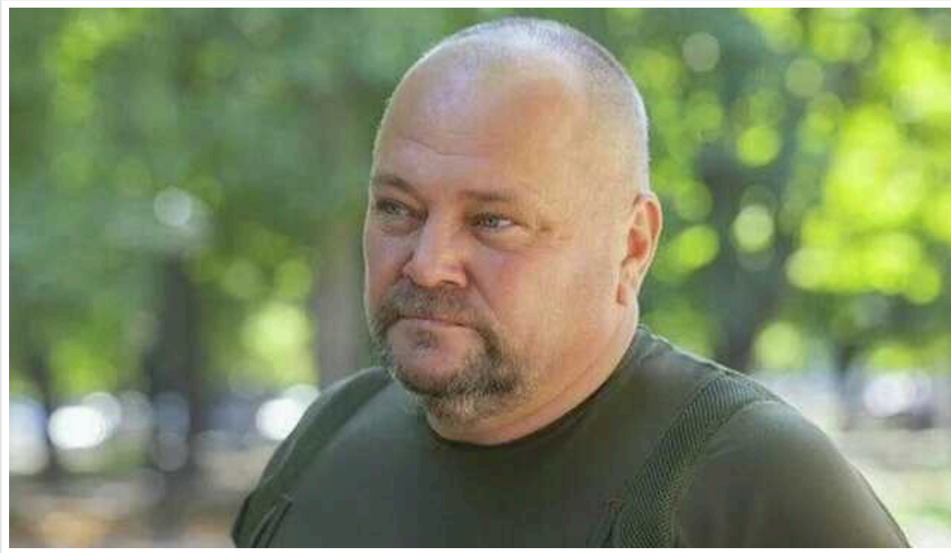
У РФ заарештували колишнього «главу адміністрації» Лисичанська

У РФ заарештували колишнього «главу адміністрації» окупованого Лисичанська, якого підозрюють в оборудках із муніципальною власністю та майном приватних підприємців.