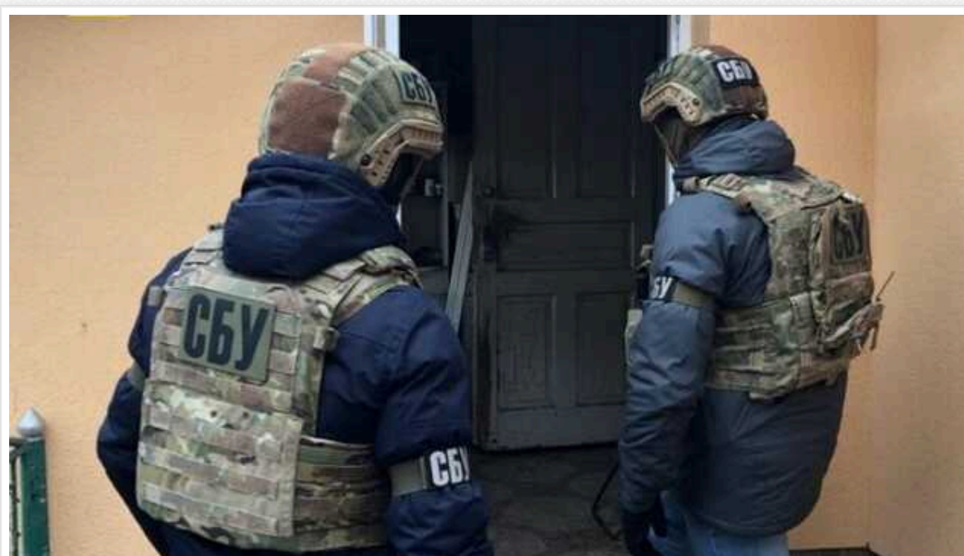
СБУ затримала інформаторів ФСБ, які шукали «слабкі місця» в обороні Слов'янська

Служба безпеки знищила на Донеччині інформаторську групу ФСБ. Затримано двоє зловмисників, які брали участь у підготовці бойових операцій РФ проти Сил оборони в районі Слов'янська.