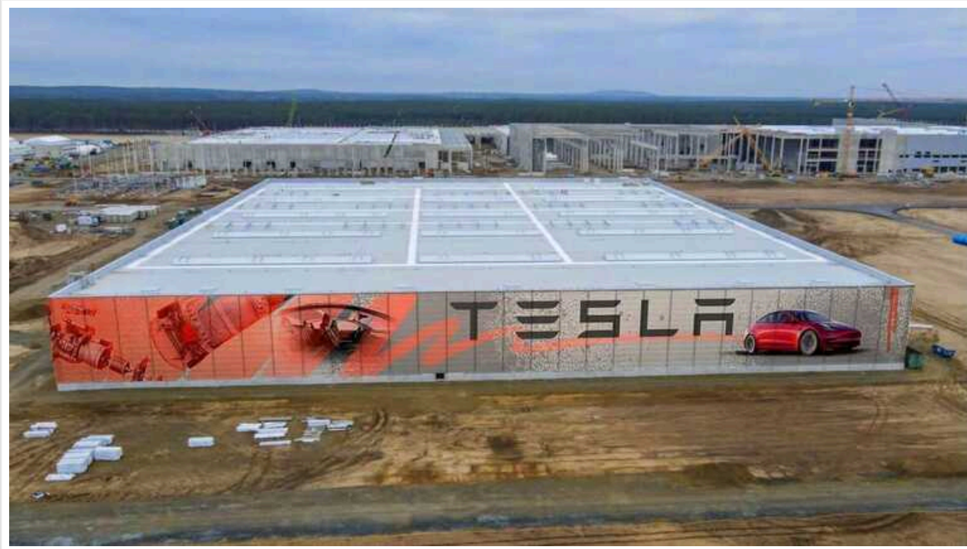
У Німеччині відкрили справу проти ультралівих, які атакували завод Tesla

Прокуратура східнонімецького міста Франкфурт-на-Одері розпочала розслідування нещодавньої атаки ультралівих екоактивістів на електромережу, що постачає енергію на завод Tesla поблизу Берліна.