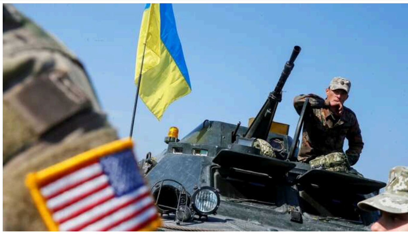
Союз між США та Україною демонструє «ознаки зношення», - NYT

Американці роздратовані, що Україна витрачає сили у другорядних битвах.