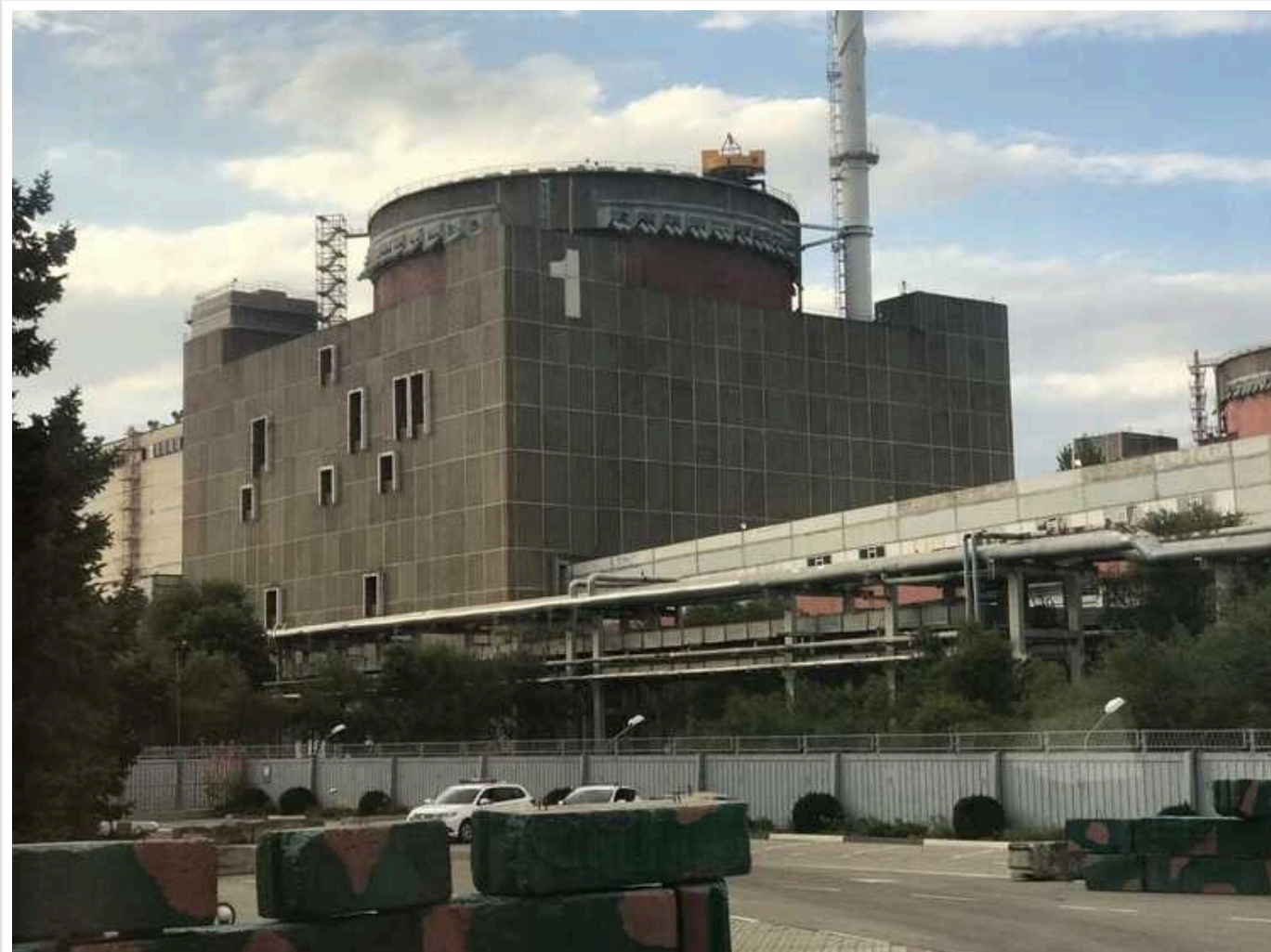
МАГАТЕ закликло терміново повернути Запорізьку АЕС під контроль України

Рада керівників МАГАТЕ закликала терміново повернути Запорізьку АЕС під повний контроль України.